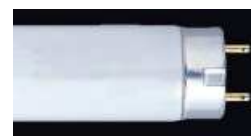
直管蛍光灯ランプ

既存の蛍光灯照明器具をそのまま利用して直管蛍光灯ランプを直管LEDランプに交換する場合は、照明器具との組合せを間違えると発煙や火災の原因となる可能性がありますので、十分な注意が必要です。LEDランプに交換する際は、 次の4点 を事前にご理解いただいたうえで、購入のご判断をお願いします。